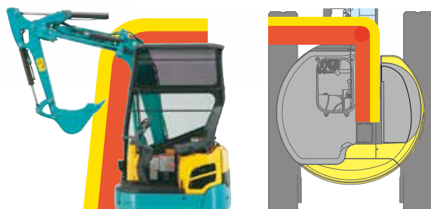
■ 自動回避領域 ■ 干渉防止領域

バケットが運転室に衝突しないよう、干渉領域に入る前に、ブームが止まることなく滑らかに運転室を回避。従来のようにブームが止まり、再作動時にはブームを干渉領域外まで戻す必要がなく、ノンストップで作業が続行できます。オペレータはストレスを感じることなく、作業効率もアップします。